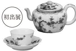
色絵 花鳥文 杯・輪花皿 伊万里(桶右衛門様式) 江戸時代(17世紀後半) 口径 杯6.5cm 皿10.6cm