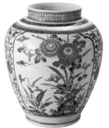
色絵 菊花文 壺 伊万里(桶右衛門様式) 江戸時代(17世紀後半) 高25.6cm