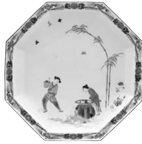
色絵 甕割人物文 八角皿 ドイツ・マイセン窯 18世紀前半 口径30.0cm

今展では初出展作品を交えつつ、輸出時代の古伊万里を中心に約80点を展観。東西文化の交錯した時代を古伊万里から紐解きます。